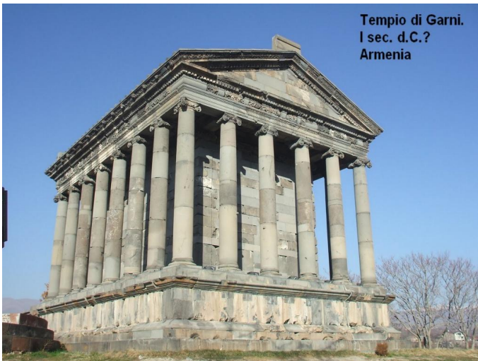
Tempio di Garni. I sec. d.C.? Armenia

L'ordine ionico si sviluppò a partire dal VI sec. a.C.